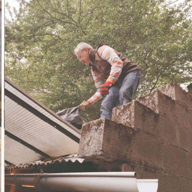
Une météo favorable aux travaux d'extérieur le samedi et idéal pour le bricolage intérieur le dimanche. Et un programme toujours un peu ambitieux pour maintenir la motivation de chacun !