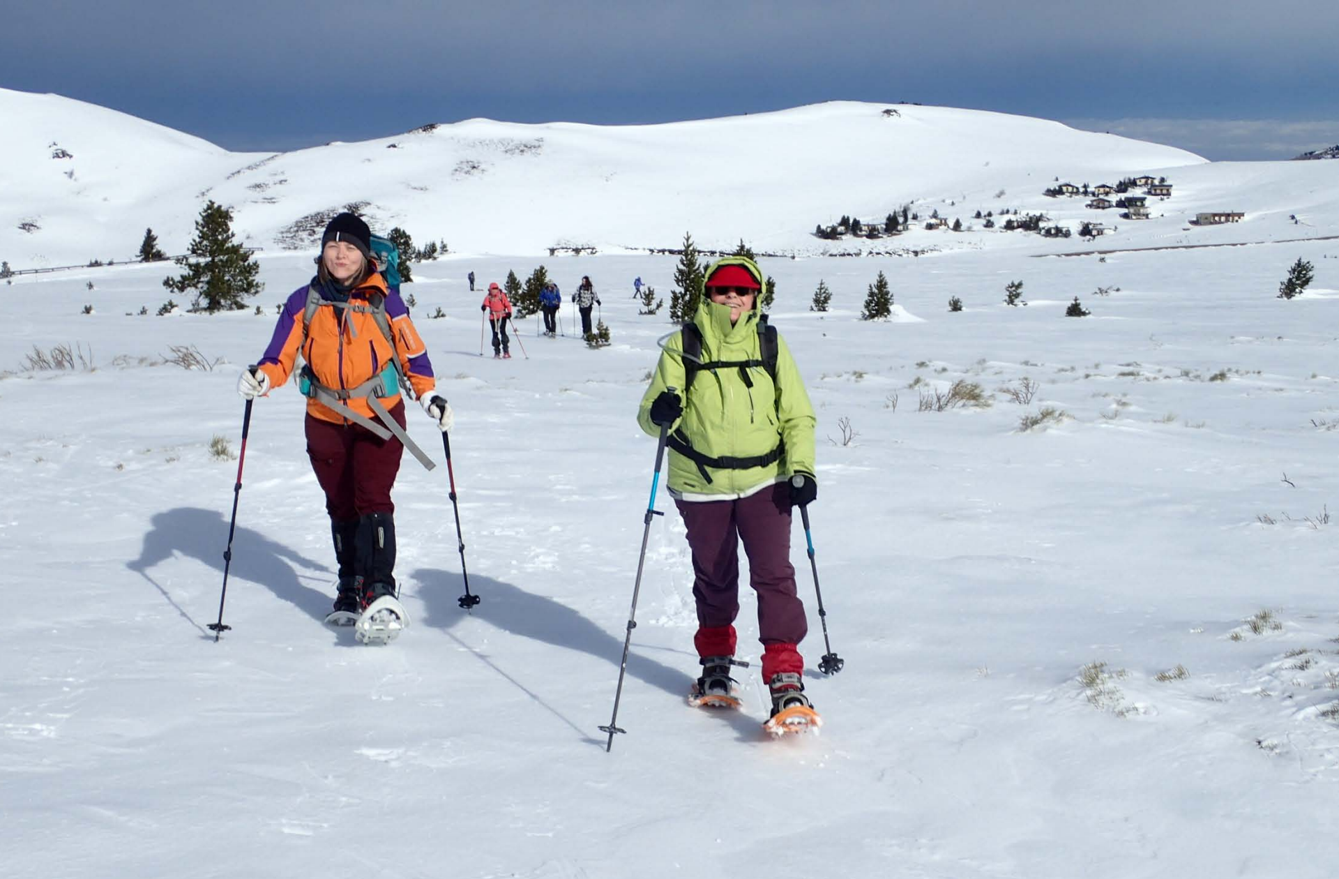
Le soleil est arrivé, c'est tout plat et tout va bien !