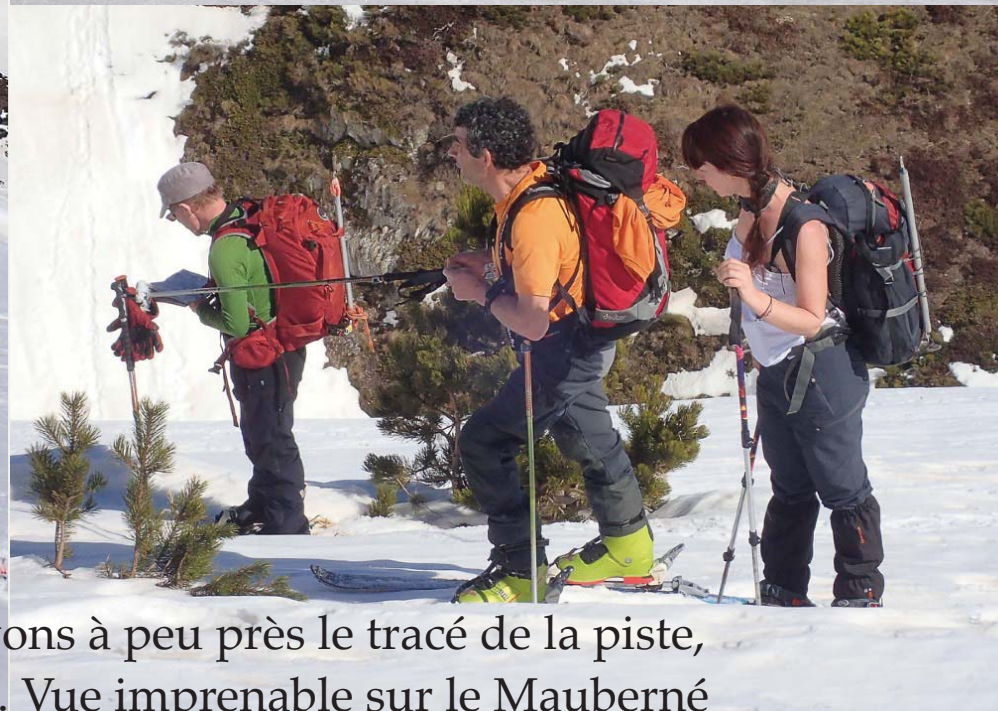
Au niveau de la cabane de Moredo, nous suivons à peu près le tracé de la piste, que l'on devine à peine sur le versant enneigé. Vue imprenable sur le Mauberné (2880 m).