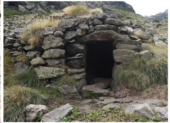
Pic de Cabayrou

Plutôt que d'affronter le raidillon de Lagardelle à l'aller, nous avons choisi de monter vers l'étang de Roumazet, plus clément pour nos genoux. Nombreux Orris le long du chemin, allant de la ruine complète à la cabane (presque) habitable.