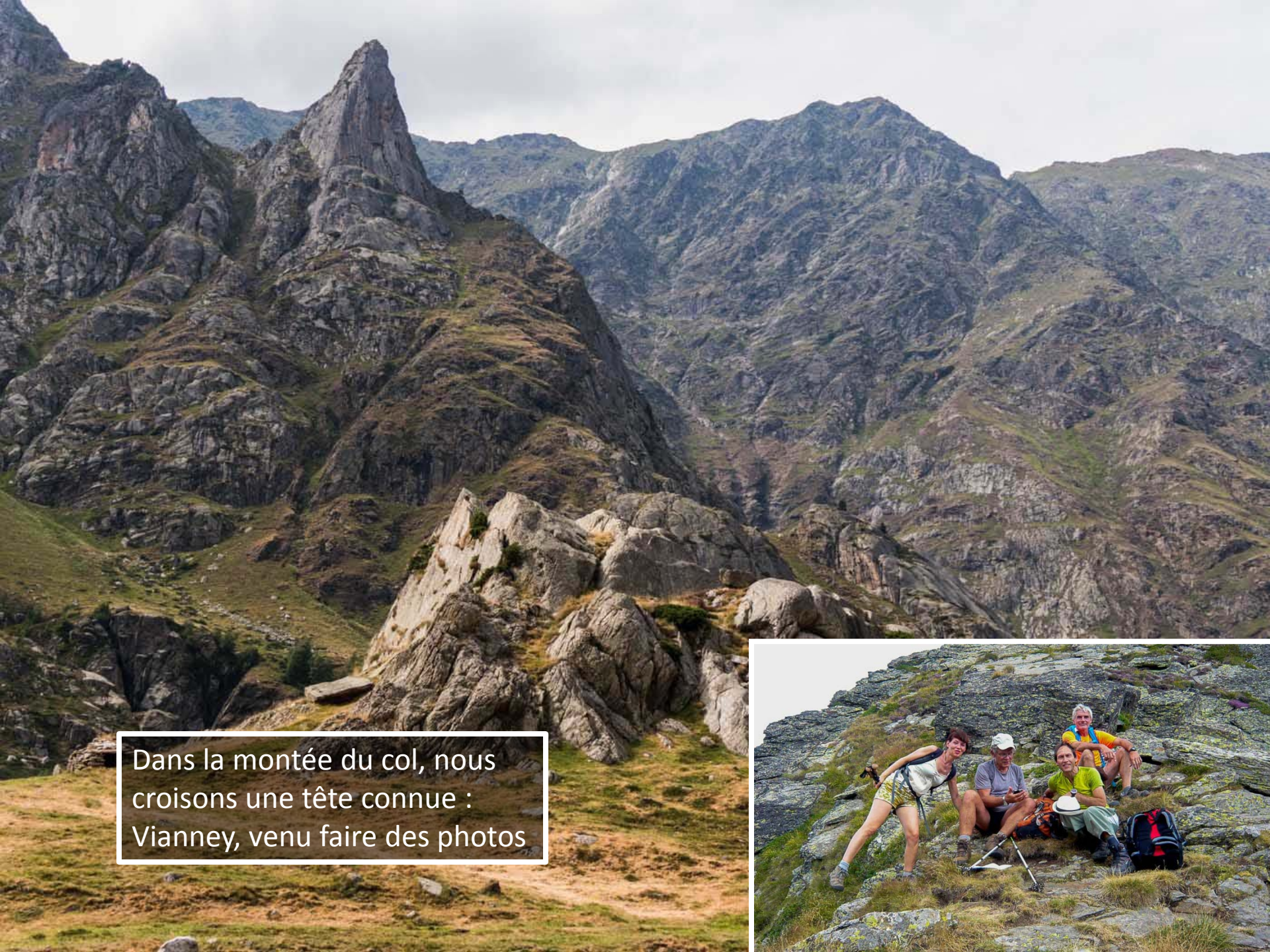
Dans la montée du col, nous croisons une tête connue : Vianney, venu faire des photos