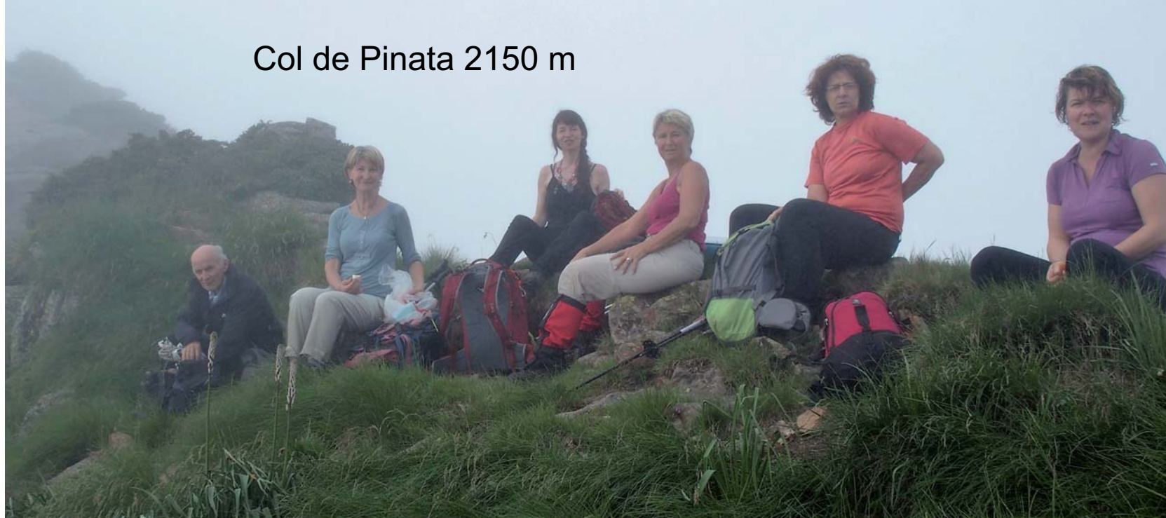
Col de Pinata 2150 m